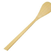
Une spatule en bois