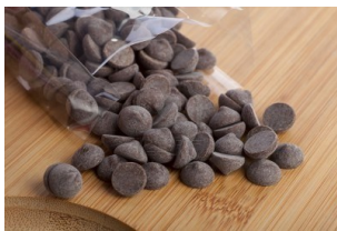
Pépites de chocolat