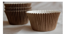
Des moules à muffin