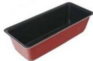
Un moule à cake